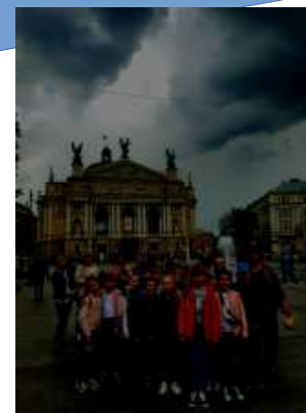
Музейні уроки, екскурсії