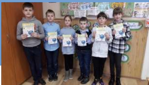
Переможці конкурсів «Колосок»