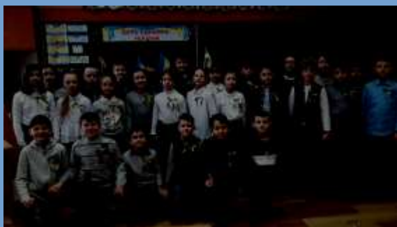
День єднання День рідної мови